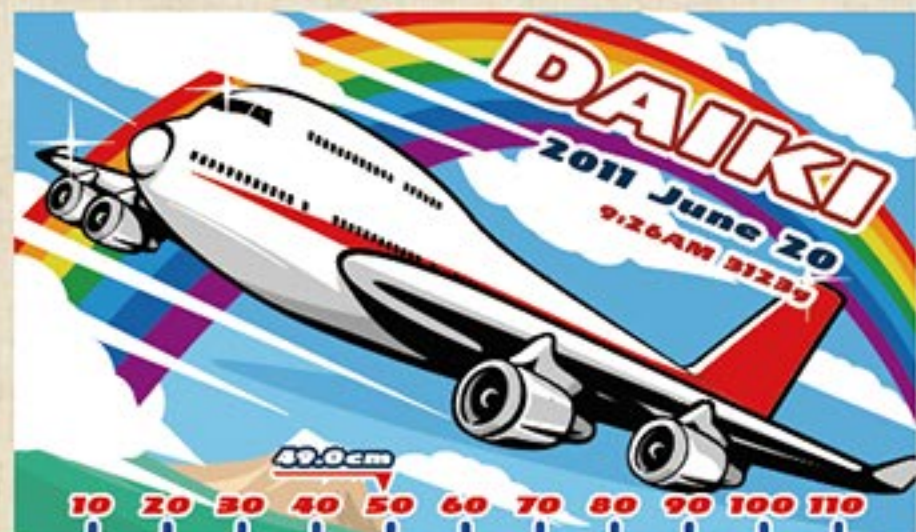
ジャンボジェット 注文番号：CA-PO-B03