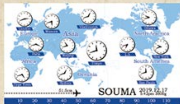
世界時計 (ブルー) 注文番号 CA-CL-B11