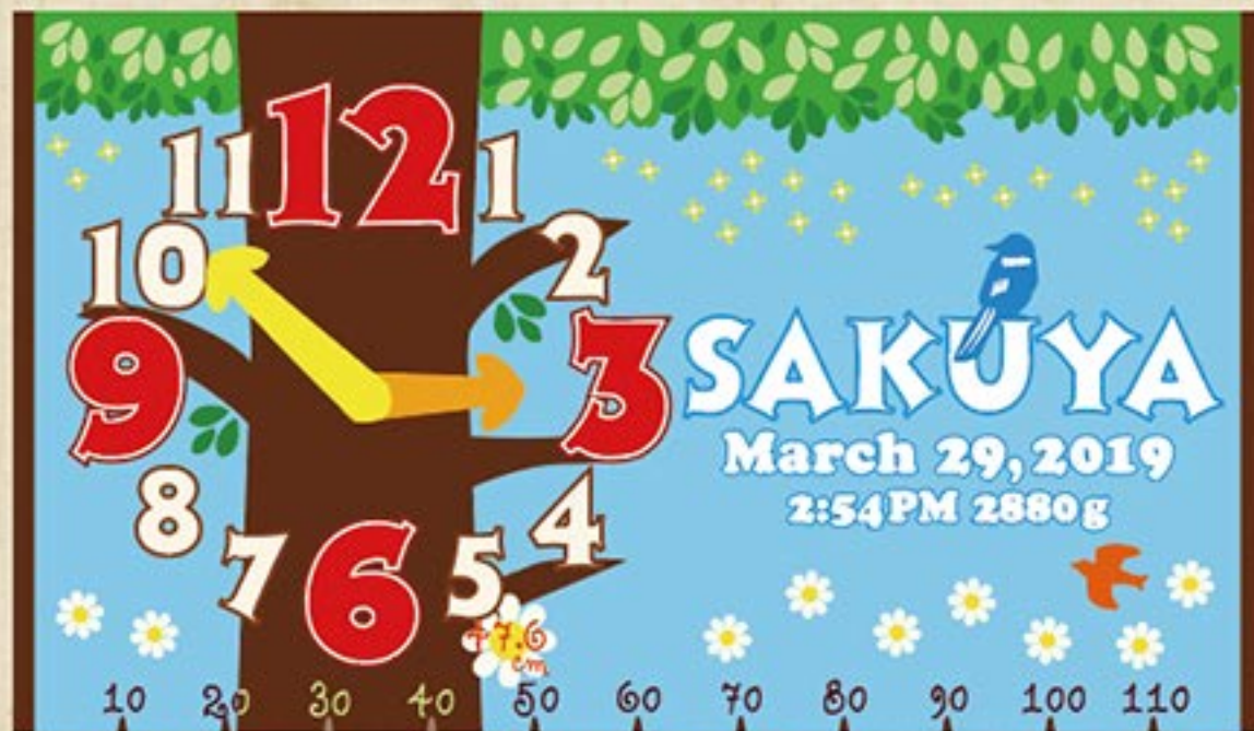
ツリークロック (ブルー)

時計デザインシリーズ 出生時間に時計の針を合わせてデザインする 時計デザインです。