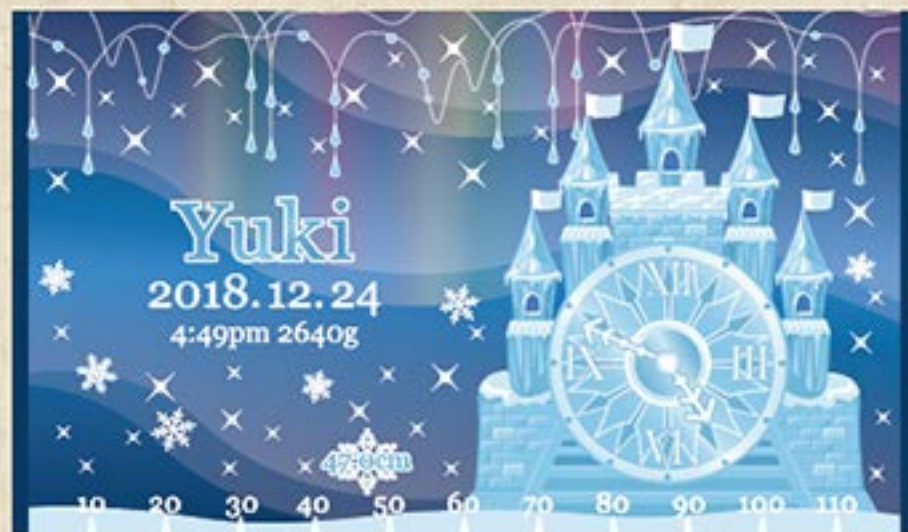
氷の城 注文番号: CA-CL-B09