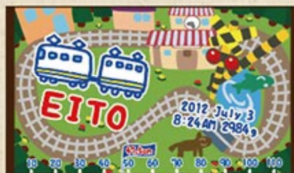
でんしゃ B 注文番号 CA-SK-B04