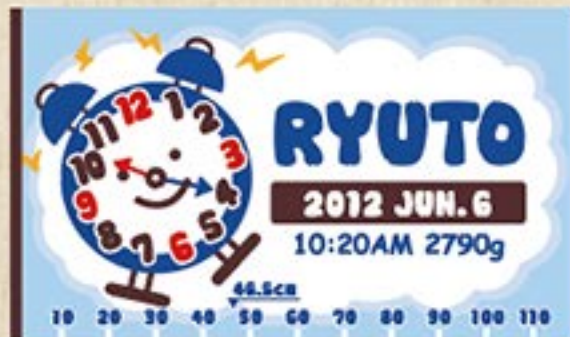
目覚まし時計 (ブルー) 注文番号 CA-CL-B03