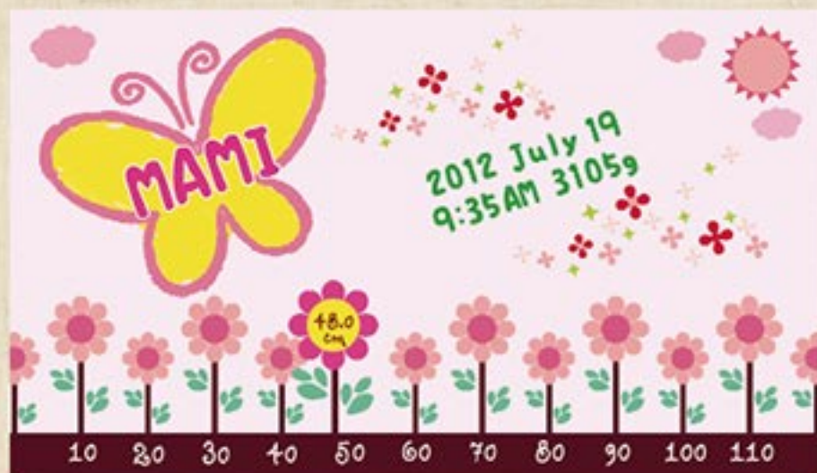
ちょうちよ 注文番号：CA-SK-B02