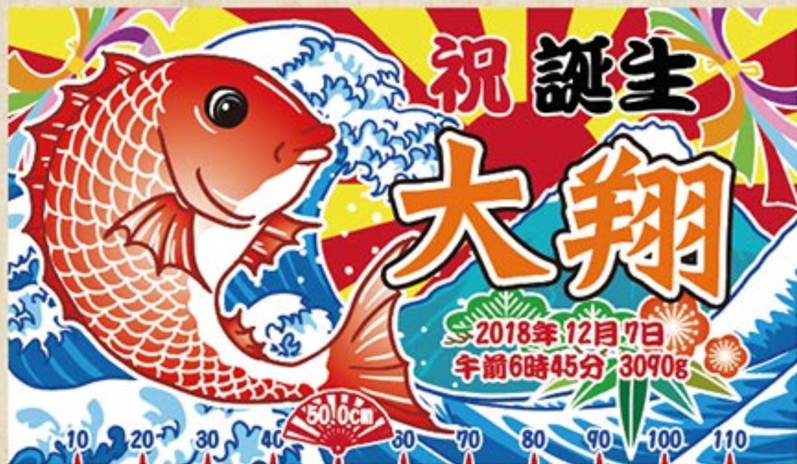
大漁旗 鯛と富士山