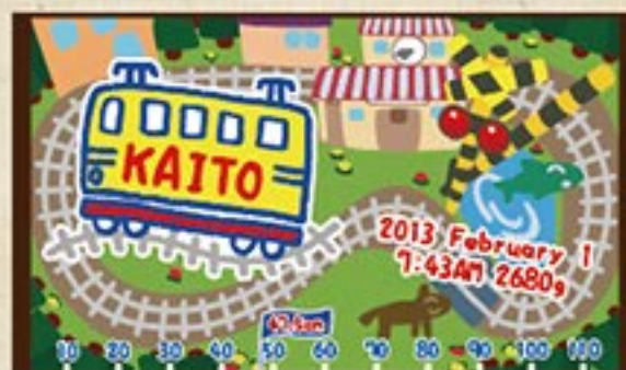
でんしゃ A 注文番号 CA-SK-B03