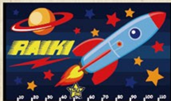
宇宙ロケット 注文番号 CA-OT-B07