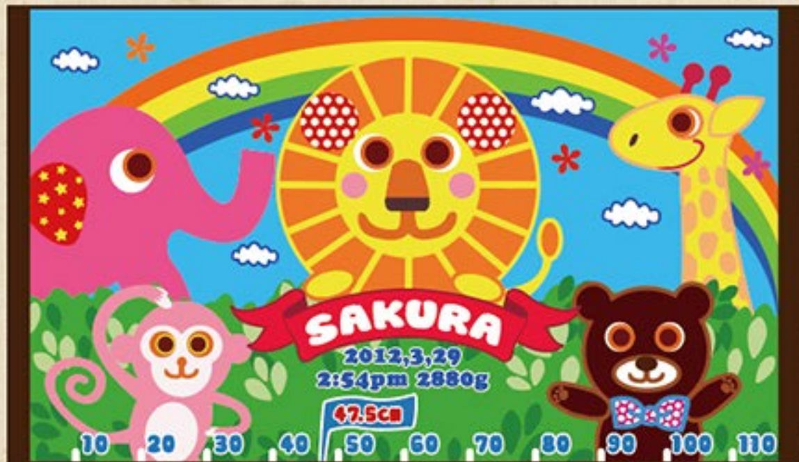
アニマルワールド

人気の動物を集めたシリーズです。 出産の記念から、幼稚園・保育園まで お気に入りにしてお使いいただけるデザインです。