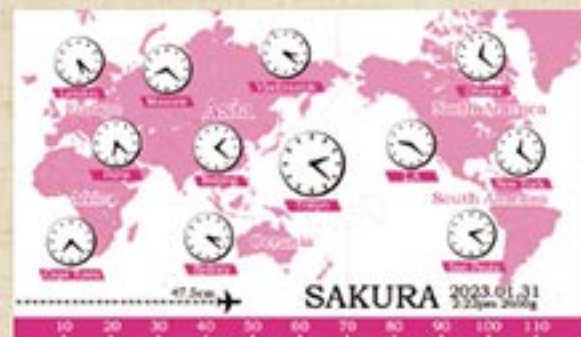
世界時計 (ピンク) 注文番号 CA-CL-B12