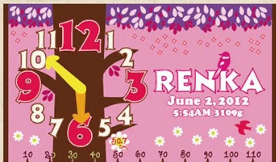
ツリークロック (ピンク)