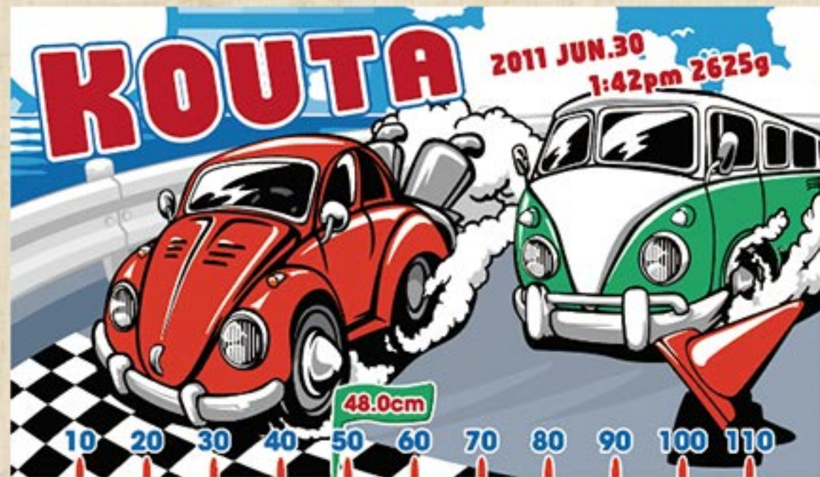
カーレース 注文番号：CA-PO-B01

ポップデザインシリーズ ポップで楽しいイラストのシリーズです。 海水浴やプールでも使いたくなる目を引く デザインが人気です。