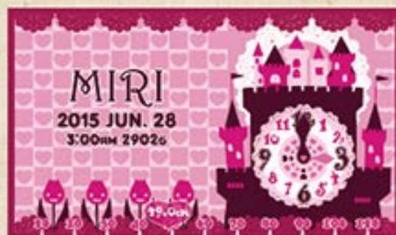
キャッスルクロック (マゼンタピンク)