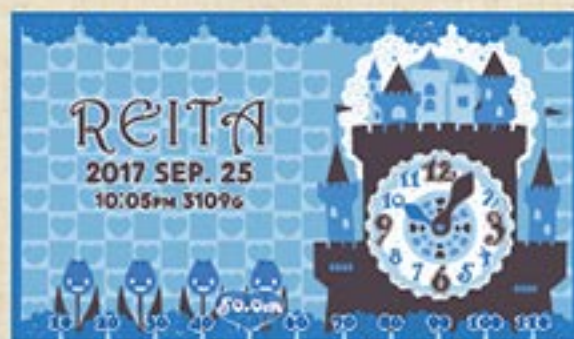
キャッスルクロック (ロイヤルブルー)