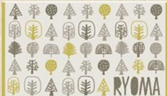
森の木 (イエロー) 注文番号 CA-OT-B11