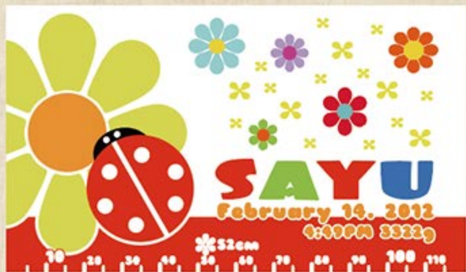
てんとうむし 注文番号：CA-PO-B02