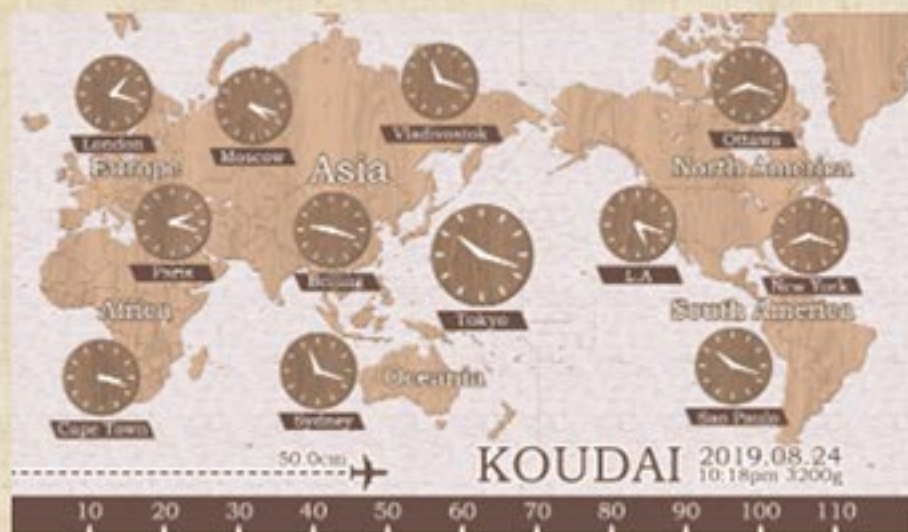
世界時計(ナチュラルウッド) 注文番号: CA-CL-B10