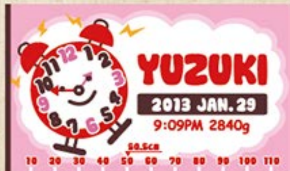
目覚まし時計 (レッド) 注文番号 CA-CL-B04