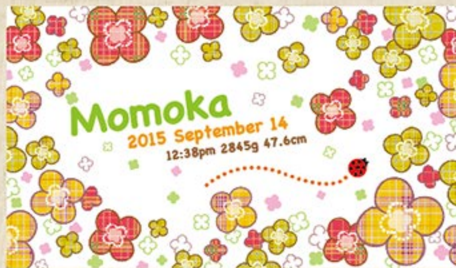
クローバー 注文番号 : CA-OT-B09